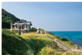
宗像大社沖津宮遙拝所