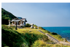
宗像大社沖津宮遙拝所