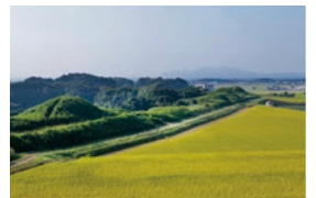
新原・奴山古墳群