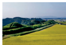
新原・奴山古墳群