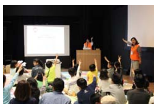
第12回お金のがっこう

当行は、2018年3月31日・4月1日に福岡市科学館で開催された「ワークショップコレクション in 福岡 2018」に参加し、当行ブースには2日間で約900人が来場されました。