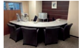
NCB相続プラザ相談ブース

西日本シティ銀行は、知識・経験が豊富な“相続の専門スタッフ”が常駐し、相続に関する基本情報の提供から専門的なアドバイスまで、トータルサポートを行う相続コンサルティング専門拠点である「NCB相続プラザ」(NCB大名支店ビル4F)、「NCBプレミアラウンジ」(西日本FH北九州ビル4F)を開設しています。