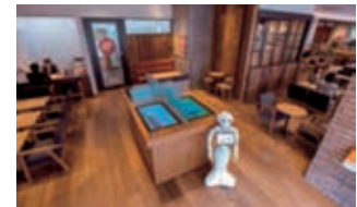
カフェと併設するレイアウト

西日本シティ銀行は、「シアトルズベストコーヒー&サブウェイ」とコラボレーションし、ロボット「ペッパー」や「タブレットテーブル」等のICT技術を導入した新形態の店舗「ワンクカフェ」(九州大学六本松キャンパス跡地)に開設しています。相続をはじめ、お金に関するさまざまなご相談におこたえしています。