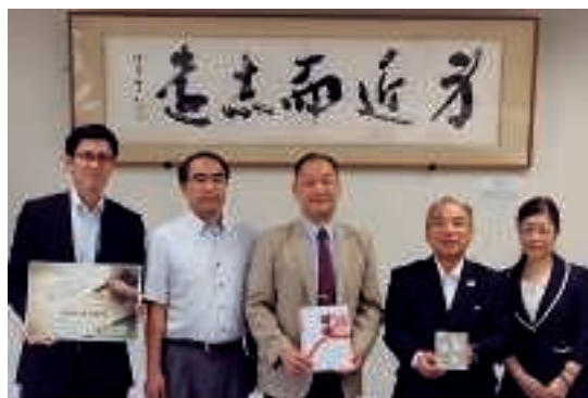
アスカコーポレーション株式会社から北九州工業高等専門学校へ 展示ケースを寄贈