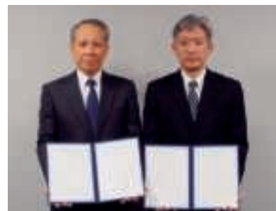
「働き方改革に係る包括連携協定」の締結